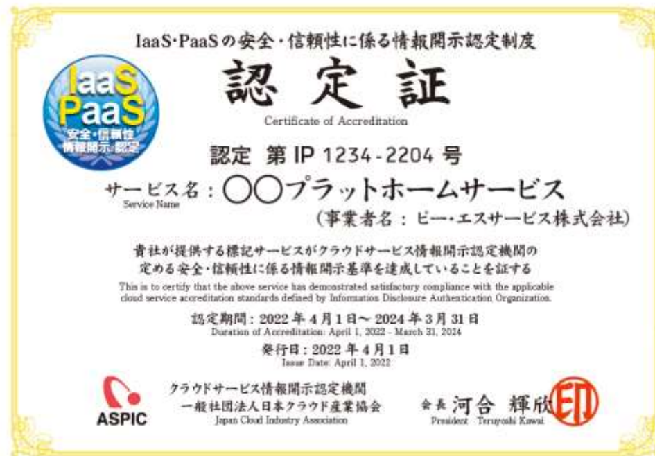
図 1 認定証（サンプル）