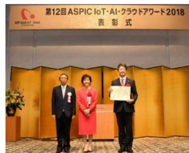
アワード2018(第12回) 佐藤ゆかり総務副大臣より授与