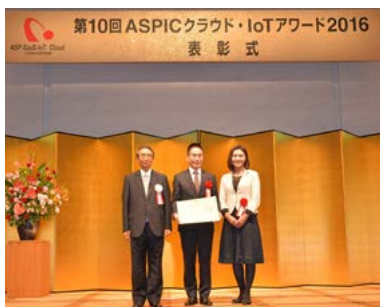
アワード2016(第10回) 金子めぐみ総務大臣政務官より授与