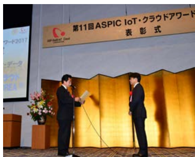
アワード2017(第11回) 坂井学総務副大臣より授与